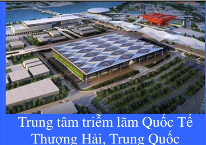
Trung tâm triển lãm Quốc Tế Thượng Hải, Trung Quốc

Địa điểm triển lãm mới cho phát triển Hội chợ triển lãm Thượng Hải và trung tâm hội nghị Thượng Hải, Trung Quốc 21-23/09-2011 Hội chợ lớn và có uy tín nhất tại Trung Quốc từ năm 1986 Gặp gỡ HƠN 600 nhà cung cấp hàng đầu thế giới từ 20 quốc gia.