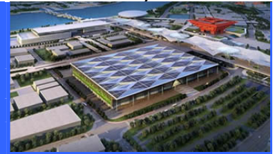
Шанхайский Международный Выставочный Экспо Центр, Шанхай, Китай

Более 600 поставщиков мирового уровня из 20 стран/регионов под одной крышей